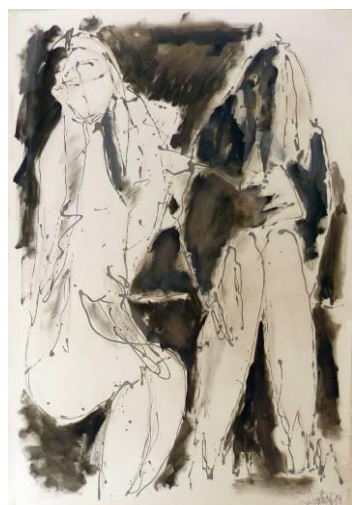
30. Ames déchirées, dripping fluide et huile sur papier, 73x110