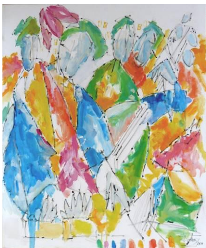
5. Rock&Roll 05 , huile sur toile, 100x120