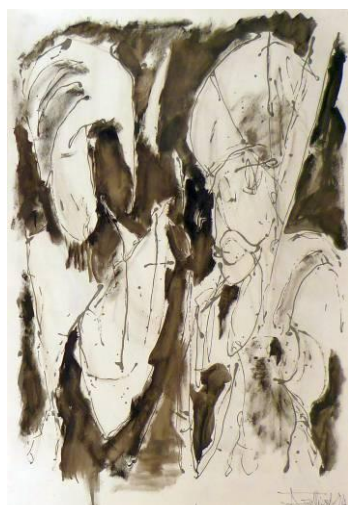
31. Pour la paix ou la guerre ?, dripping fluide et huile sur papier, 73x110