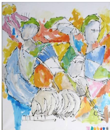
1. Rock&Roll 01 , huile sur toile, 100x120