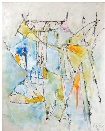
25. Déconstruction, 02 , dripping-sliding et huile sur papier, 100x120