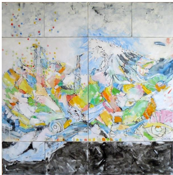
14. Zone interdite (après le tsunami à Fukushima), huile sur toile, 200x200