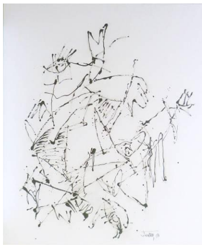
18. Interlude Le roi danse , dripping-sliding gris foncé sur toile avec bout de bois sur dessin au fusain, 100x120