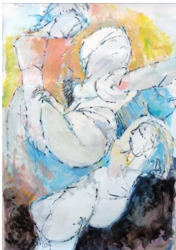
20. L'enlèvement des Sabines , d'après Rubens, huile sur papier, 80x120