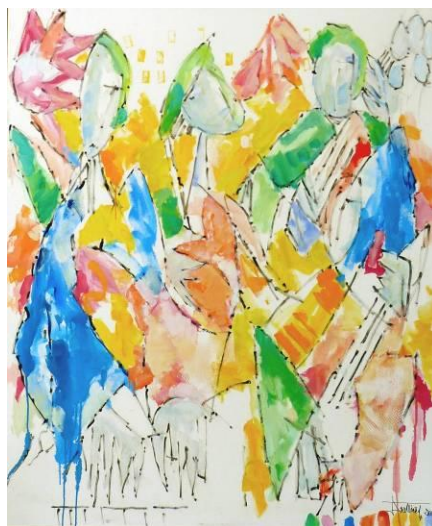
4. Rock&Roll 04 , huile sur toile, 100x120