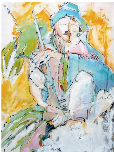
9. L'enfant soldat , huile sur toile, 100x130