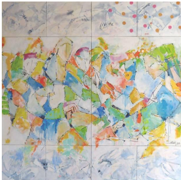
19. Alors on danse... , huile sur toile, 200x200