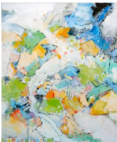
15. Sind Blitze sind Donner in Wolken verschwunden ?, ou Avant l'orage , huile sur toile, 100x120