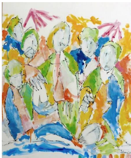
13. Rituel d'Orient , huile sur toile, 100x120