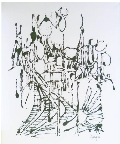
34. Paysage industriel 01 , dripping-sliding noir sur dessin au graphite, toile, 100x120