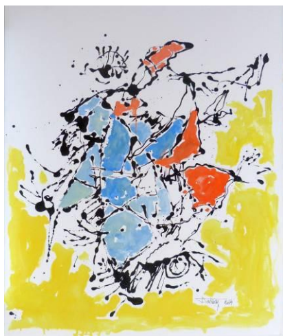
32. Le roi danse 02 , dripping-sliding noir sur dessin au graphite et huile sur toile, 100x120