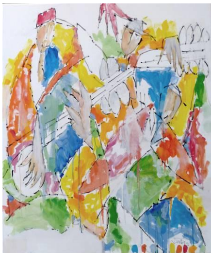
7. Blues 02 , huile sur toile, 100x120