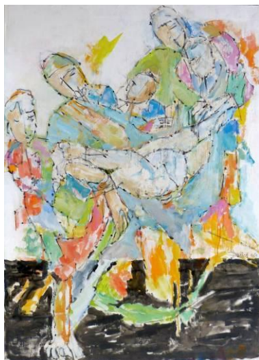
10. Terme funèbre , huile sur toile, 100x140