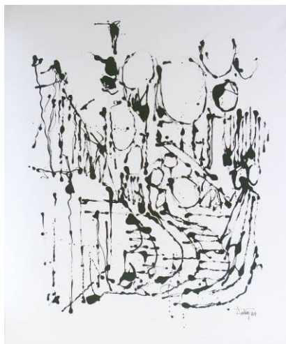
35. Paysage industriel 02 , dripping-sliding noir sur dessin au graphite, toile, 100x120