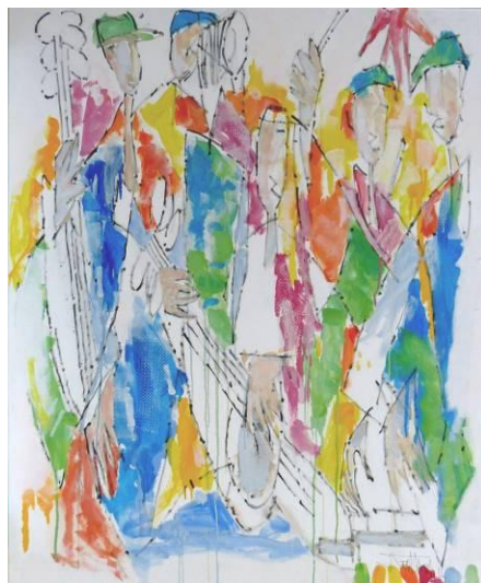
8. Blues 03 , huile sur toile, 100x120