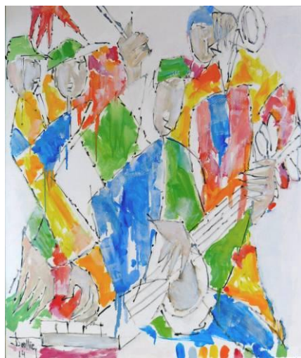
6. Blues 01 , huile sur toile, 100x120