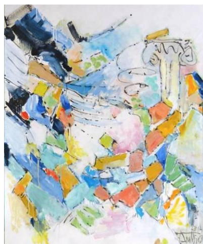
16. Richter 6 & Typhon , huile sur toile, 100x120