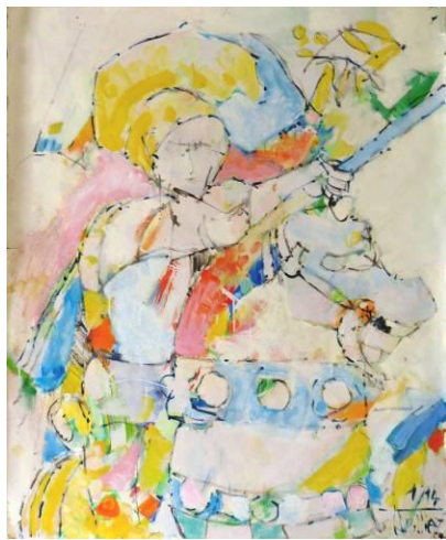
21. Saint Georges , d'après Ucello, dans la Bataille de San Romano , huile sur papier, 100x120