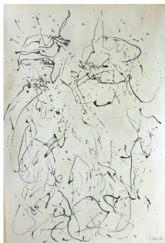
27. Le couple , dripping libre gris foncé, sur papier, 73x110