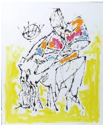
17. Tango , dripping-sliding noir ardoise avec bout de bois sur dessin au graphite et huile sur toile, 100x120