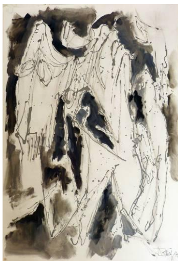
29. 'Eurydice en enfer, dripping fluide et huile sur papier, 73x110