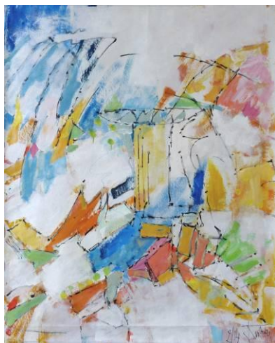
23. Richter 6 - 02 , huile sur papier, 100x120