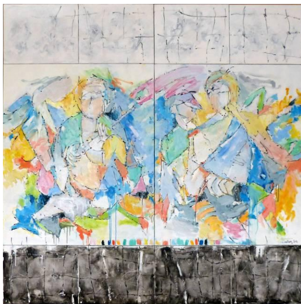
11. Liberté sous condition , huile sur toile, 200x200