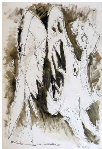
28. Le cheval de Guernica, revisité d'après Picasso (1937), dripping fluide et huile sur papier, 73x110