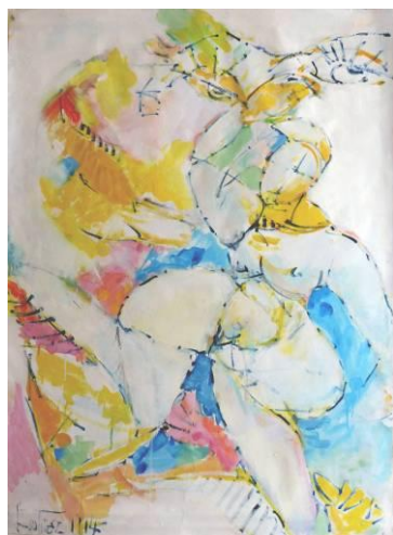
26. Danseuse et voyeur , hommage à Botero, huile sur papier, 100x120