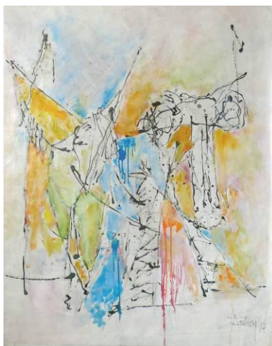
24. Déconstruction 01 , dripping-sliding et huile sur papier, 100x120