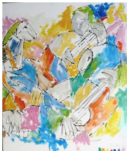
2. Rock&Roll 02 , huile sur toile, 100x120