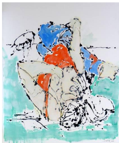
33. Danse au sol , dripping-sliding noir sur dessin au graphite et huile sur toile, 100x120