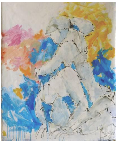
22. Les lutteurs , huile sur papier, 100x120